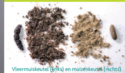
Vleermuiskeutel (links) en muizenkeutel (rechts)

Vleermuiskeutels zijn erg droog (vleermuizen eten enkel insecten) en uitstekende meststoffen (guano). Er is geen reukhinder, tenzij in vochtige ruimten.